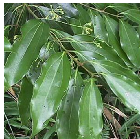
ヤブニッケイ クスノキ科クスノキ属の植物の一種。ご飯に入れて炊くと良い。