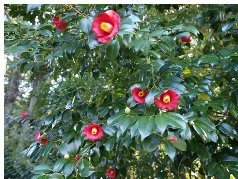
ヤブツバキ ツバキ科ツバキ属の常緑樹。小さな花をてんぷらに。