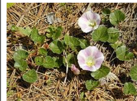
ハマヒルガオ ヒルガオ科ヒルガオ属の多年草。