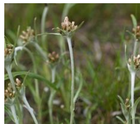
チチコグサ キク科ハハコグサ属の植物。若芽をてんぷらにする。