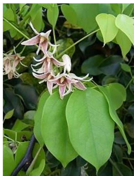
ムベ アケビ科ムベ属の常緑つる性木本植物。