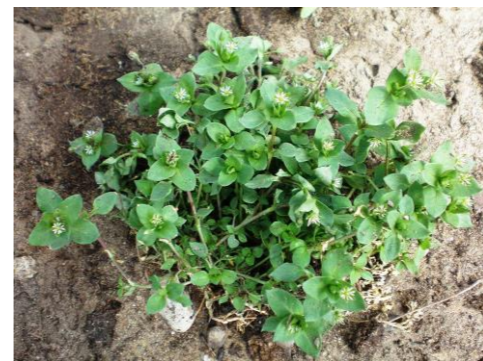
コハコベ ナデシコ科ハコベ属の越年草。 おひたしにするとうまい。