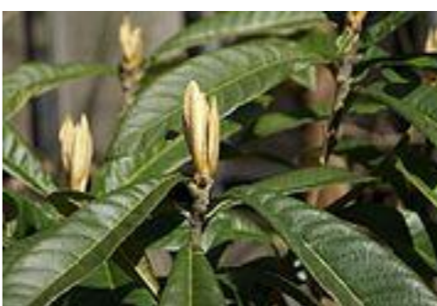
ビワ バラ科の常緑高木。若芽をてんぷらに。