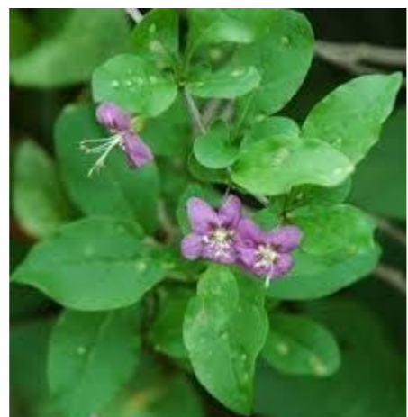
クコ 東アジア原産のナス科の落葉低木。若芽をてんぷらに。