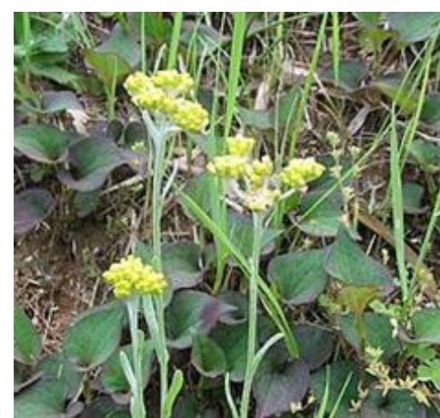
ハハコグサ キク科ハハコグサ属の越年草。春の七草の1つ、「御形」でもあり、茎葉の若いものを食用にする。