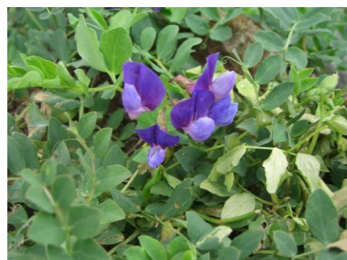
ハマエンドウ マメ科レンリソウ属の多年生。若芽をてんぷらに。