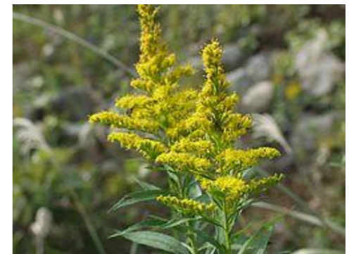
セイトカアワダチソウ キク科アキノキリンソウ属の多年草。