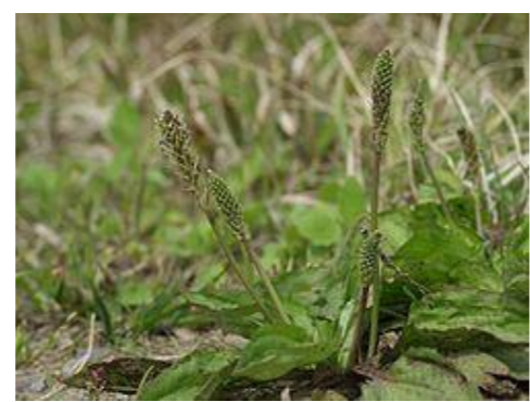
オオバコ オオバコ科オオバコ属の多年草。