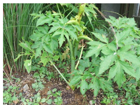
ハマウド セリ科の多年草。