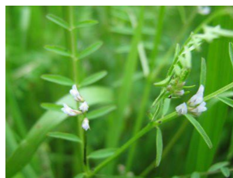
スズメノエンドウ ソラマメ属のつる性の越年草。