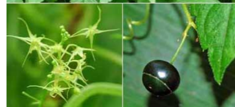
アマチャヅル ウリ科アマチャヅル属に属する多年生のツル性植物。若芽をてんぷらに。