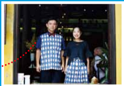
Sandwich parlor サンドイッチ パーラー