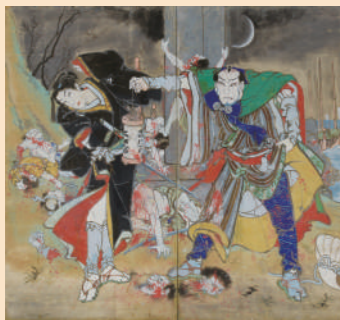
浮世柄比翼稲妻 鈴ヶ森 本町一区所蔵

絵師 金蔵、通称「絵金」(1812～1876年)は、今から約160年ほど前に土佐で活躍した絵師です。絵金は、歌舞伎や人形浄瑠璃の芝居を二つ折りの屏風に描いた「芝居絵屏風」を大成させ、有名となりました。芝居絵屏風に用いられているのが「血赤」と呼ばれる激しい赤色です。祭礼の夜を彩る絵金の強烈な「血赤」は、邪気を払う魔除けの色として庶民に受け入れられ、幕末の土佐では芝居絵屏風が大流行しました。